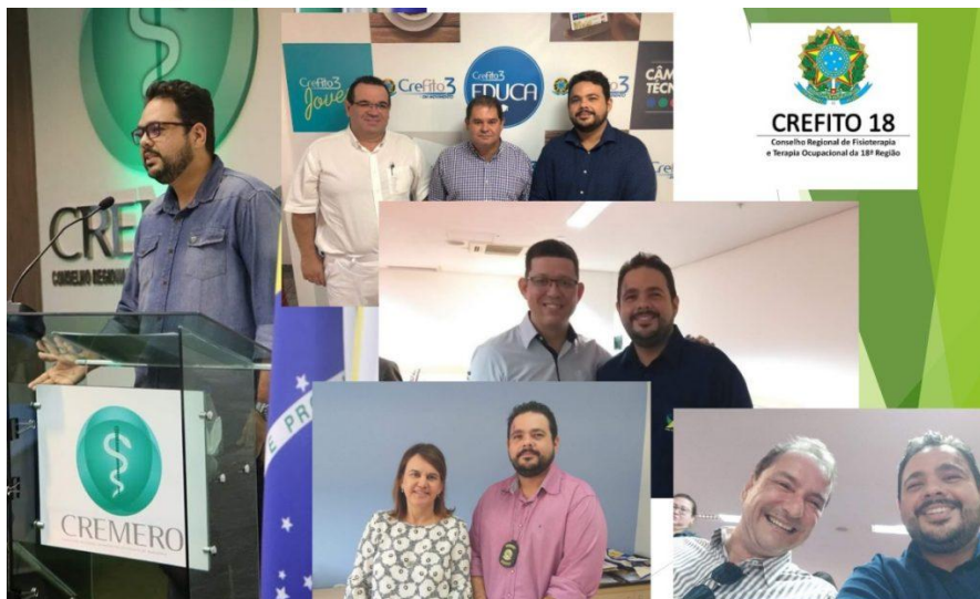
Presidente Dr Rodrigo Moreira Campos levando o valor da fisioterapia e da Terapia Ocupacional para Políticos e demais entidades.

Em 2023 tomou posse, após eleição, a segunda Gestão do CREFITO 18, com um colegiado renovado em mais de 50%. Houve disputa e o novo colegiado venceu as eleições com o voto da maioria dos profissionais de Acre e Rondônia.